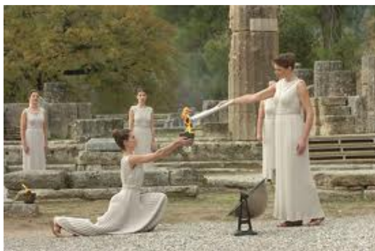
Encendido de la llama olímpica en Olimpia.

La llama olímpica se enciende, en la actualidad, por la acción de los rayos del sol y recorre un largo camino desde Olimpia hasta la sede en la que se organizan los Juegos Olímpicos, pasando, de mano en mano, por relevistas de todo el mundo, que portan orgullosos la antorcha olímpica.