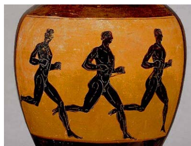
Representaciones artísticas de los antiguos JJOO