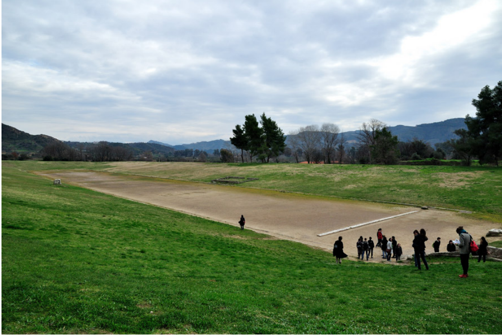
Estadio de Olimpia en la actualidad

Tal como hemos dicho anteriormente, los Juegos Olímpicos en Grecia tenían un marcado carácter místico y religioso, con lo cual se celebraban muchos acontecimientos dirigidos a la divinidades, sobre todo a Zeus, como dios supremo del Olimpo. Es por ello que todos los juegos se comenzaban con la ceremonia del encendido del fuego olímpico, aspecto este que se conserva hoy en día.