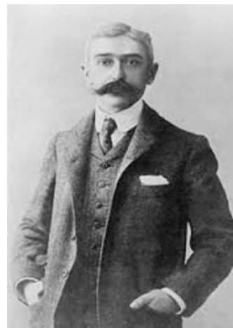
Barón Pierre de Coubertein

En un principio, a pesar de que tenemos que agradecer a Coubertein la recuperación de los Juegos Olímpicos, sus ideas conservadoras no permitían la participación de mujeres, aunque poco a poco, estas fueron ganando protagonismo y, afortunadamente hoy en día tienen una participación en igualdad de importancia y prestigio que los hombres.